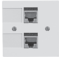
Appareil F EDIZIOdue