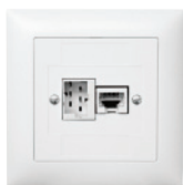
EDIZIOdue FMI 88x88 mm