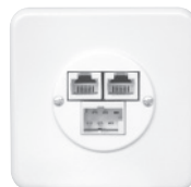
Standard PMI Ø43 mm