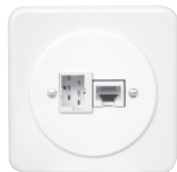
Standard PMI Ø58 mm