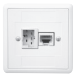
EDIZIOdue FX39 79x79 mm