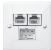
Standard 60x60 mm